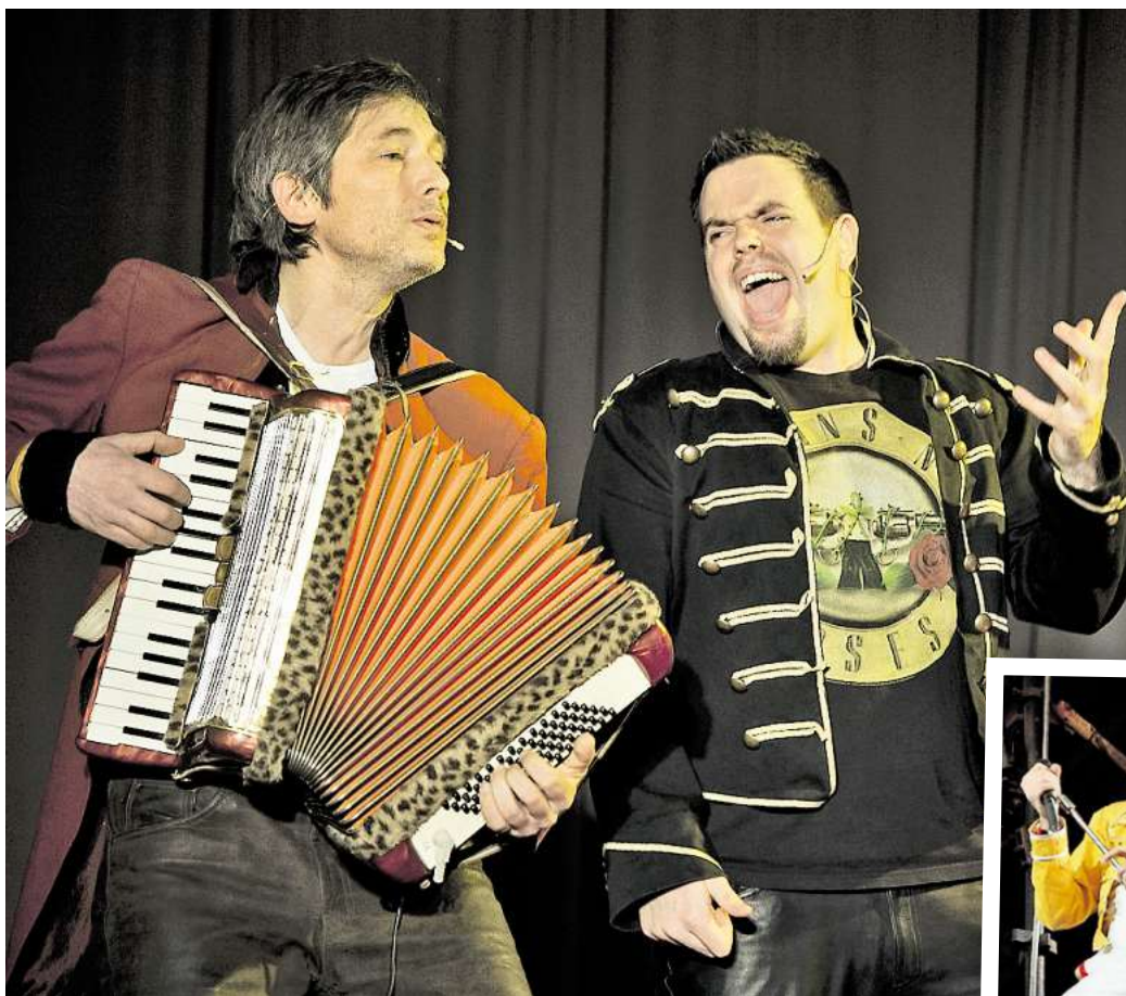
„The Royal Squeeze Box“ laden zu einer experimentellen Musikstunde in die Martin-Luther-Kirche in Edemissen ein. Kleines Foto rechts: Freddie Mercury.

Musiker sind spezialisiert auf Songs von Queen und Freddie Mercury und bieten eine „große Show auf kleinstem Raum“