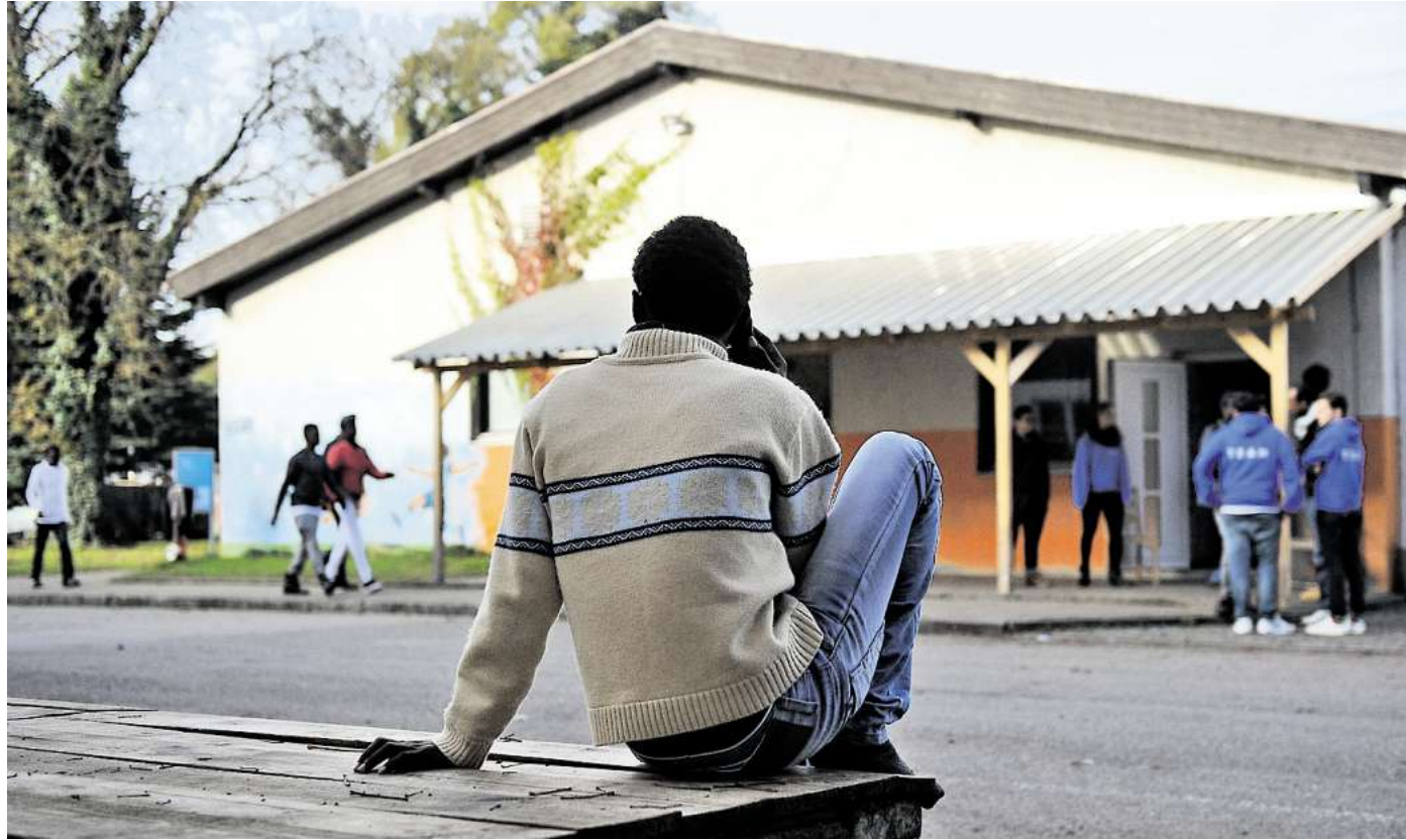
Asylbewerber kommen zunächst in Zentrale Aufnahmeeinrichtungen wie hier im bayerischen Zirndorf. Dann werden sie weiter auf die Kommunen verteilt.