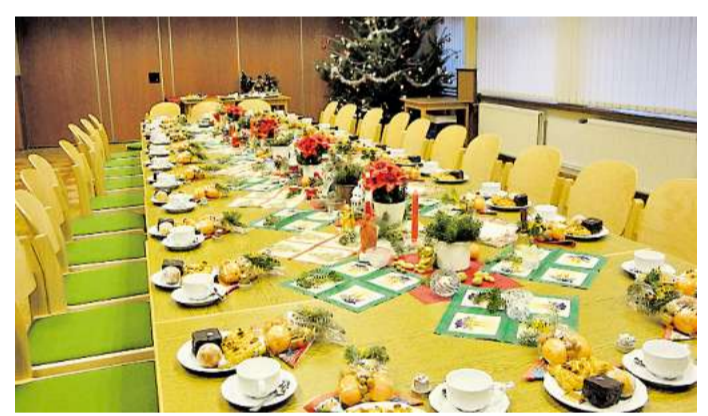
Der Tisch war für die Weihnachtsfeier liebevoll gedeckt.

für Unterhaltungen, in denen Erinnerungen ausgetauscht wurden. „Es war wieder eine sehr schöne Weihnachtsfeier“, war hinterher vielfach zu hören.