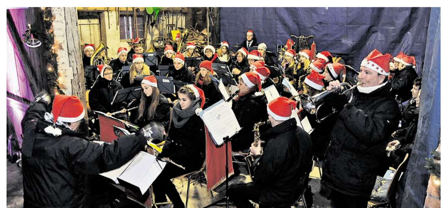
Lustige Farbtupfer waren die Weihnachtsmann-Mützen, die die Musiker passend zum Adventskonzert aufgesetzt hatten.

Die Mühe hat sich gelohnt: Sowohl die Musik als auch der neue Veranstaltungsort kamen bei den Zuhörern hervorragend an.