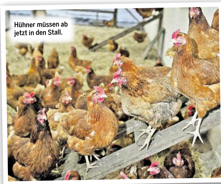
Hühner müssen ab jetzt in den Stall.