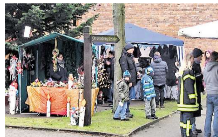
Auf dem Maibaumplatz und in der Sundernstraße in Abbensen wird am kommenden Sonnabend einiges geboten.

Hobbykünstler stellen an diesem Nachmittag ihre neuesten Arbeiten vor. Zu sehen sein werden unter anderem schicke Motivkerzen, Kränze, Gestecke, Christbaumschmuck, Tischdecken und Kissen. Handgemachter Edeltahlschmuck, weihnachtliche Dekorationsartikel, Adventsgestecke, Nikolaustrümpfe,