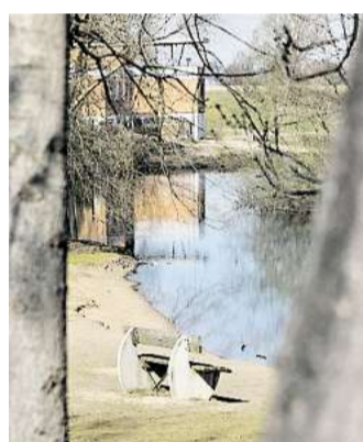
Der Eixer See gilt ab sofort als ein Aufstallgebiet. A/Z

Sechs Gebiete im Peiner Land sind betroffen: Hühner, Truthühner, Enten und Gänse müssen unter das Dach