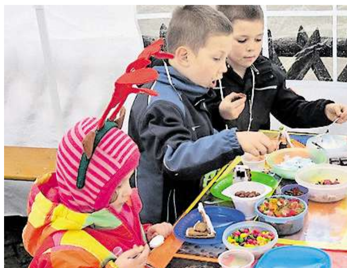
Auch an die jüngeren Besucher wird gedacht.

Kalender und Postkarten aus Abbensen komplettieren das Angebot.